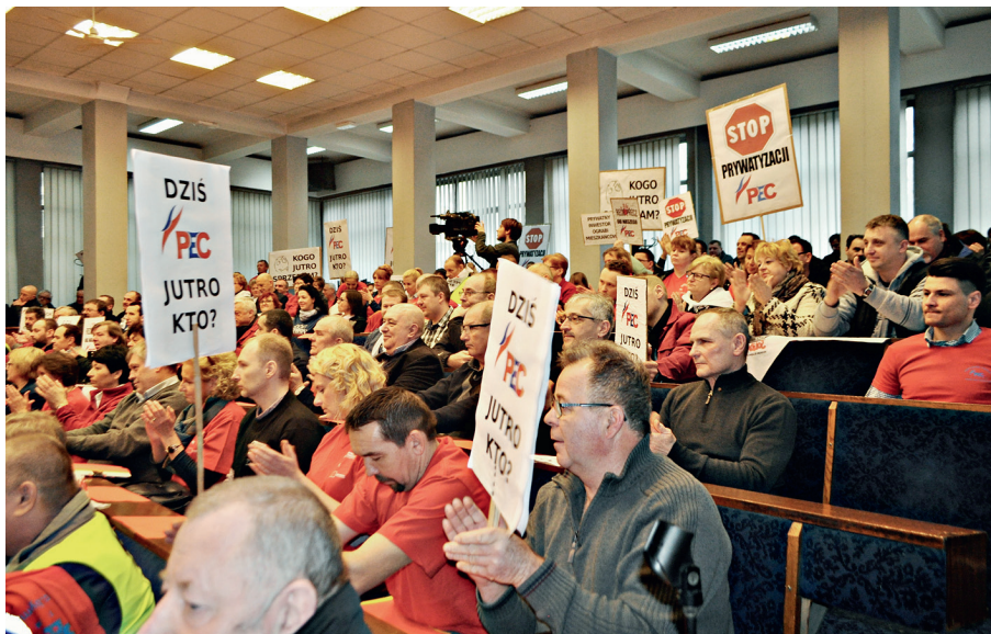
W trakcie sesji Rady Miejskiej w Bytomiu, pracownicy PEC Sp. z o.o. głośno protestowali przeciwko planom sprzedaży zakładu.

„Pan prezydent deklarował konsultowanie wszystkich ważnych spraw z mieszkańcami Bytomia. Pytamy, czy sprzedaż PEC nie wymaga zgody mieszkańców? Z całą stanowczością podkreślamy, że nie ma żadnych argumentów za prywatyzacją PEC-u. Zakład nie jest w trudnej sytuacji ekonomicznej, aby należało go w ten sposób ratować. Nie ma zagrożenia dla dostawy ciepła dla mieszkańców! Wręcz przeciwnie. PEC jest jedną z najnowocześniejszych firm tego rodzaju na Śląsku, jeśli nie w całej Polsce. Wdrożyliśmy smart metering,