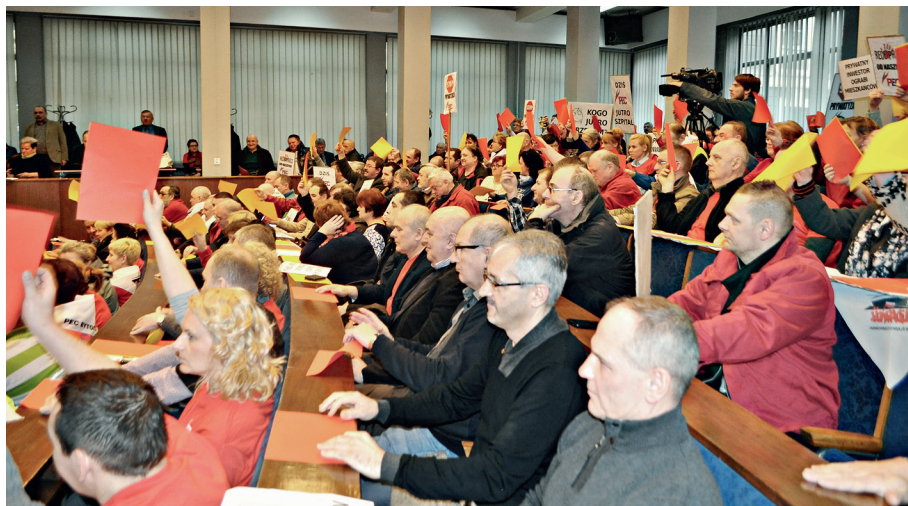
Pracownicy PEC pokazali rządzącym Bytomiem symboliczne czerwone i żółte kartki, będąc reakcją na plany związane z szukaniem oszczędności w budżecie poprzez sprzedaż miejskiego majątku.

być motywowana koniecznością dostępu do lepszych technologii czy szybszej modernizacji. PEC nie potrzebuje też kapitału na inwestycje czy remonty, bo od wielu lat finansuje je na bardzo wysokim poziomie. Co więcej poziom zatrudnienia w PEC-u jest niższy niż średnia krajowa z uwzględnieniem prywatnych przedsiębiorstw w branży – to ważny argument z punktu widzenia wszystkich zwolenników prywatyzacji, którzy uważają niski wskaźnik zatrudnienia za oznakę efektywności. Również wskaźnik awaryjności sieci ciepłowniczych jest w PEC-u jednym z najniższych w Polsce. Wreszcie cena – dostarczamy ciepło dla odbiorców jako jedno z najtańszych na Śląsku. Nie obciążamy mieszkańców nadmiernym wzrostem cen za dostarczone ciepło. Znamy przykłady sprzedanych wytwórców ciepła, czyli elektrociepłowni wraz z sieciami przesyłowymi należącymi do PEC-ów gdzie ścieżka nowych inwestycji jest powtarzalna i realizuje się poprzez skuteczną maksymalizację zysków, regularne podwyżki ceny za wyprodukowanie ciepła dla mieszkańców i redukcję zatrudnienia.”