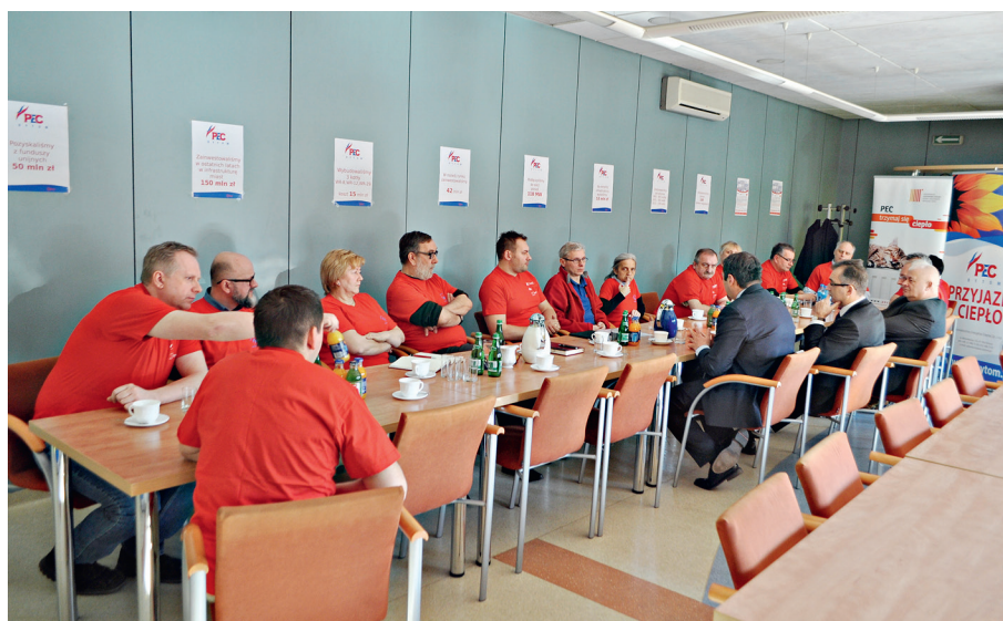
W trakcie spotkania pracownicy wyrazili stanowczy sprzeciw prywatyzacji bytomskiego przedsiębiorstwa.

Rady Miejskiej Bytomia, która zebrała się 29 lutego. W jej trakcie opozycyjni radni zgłosili projekt uchwały intencyjnej, która wyraziłaby sprzeciw sprzedaży przedsiębiorstwa jako działanie sprzeczne z interesem miasta i jego mieszkańców. Niestety wniosek, by taką uchwałę przyjąć, stosunkiem głosów 13:11 został odrzucony. W trakcie sesji członkowie związków zawodowych głośno skandowali, pokazując rządzącej większości symboliczne żółte i czerwone kartki, jako znak sprzeciwu planom prywatyzacyjnym. Były też transparenty: „Ręce precz od naszego PEC”, „W rękach miasta stabilne ceny ciepła”, „Prywatny inwestor ograbi mieszkańców”,