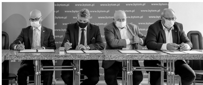
Podpisanie porozumienia dotyczącego stworzenia klastra energii.