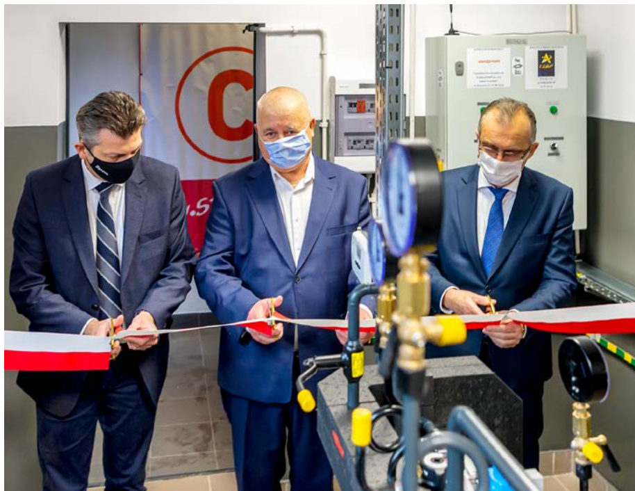
Uroczyste oddanie do użytku tysięcznego węzła ciepłego.

Tysięczny węzeł ciepły zabudowany przez PEC jest symbolem walki z niską emisją, ograniczenia emisji CO 2 oraz pyłów zawieszonych. Jak wynika z przeprowadzonych przez nas analiz przyłączyliśmy do tej pory ok. 37 tys. mieszkań w Bytomiu i ok. 2,2 tys. w Radzionkowie. W latach 2000-2020 zrealizowaliśmy inwestycje i przeprowadziliśmy prace remontowe na łączną kwotę ok. 315 mln zł. Zakończone i prowadzone przez nas projekty unijne przekładają się na ograniczenie emisji pyłów zawieszonych o ok. 8-18 ton rocznie oraz CO 2 o ok. 4,6 tys. ton rocznie.