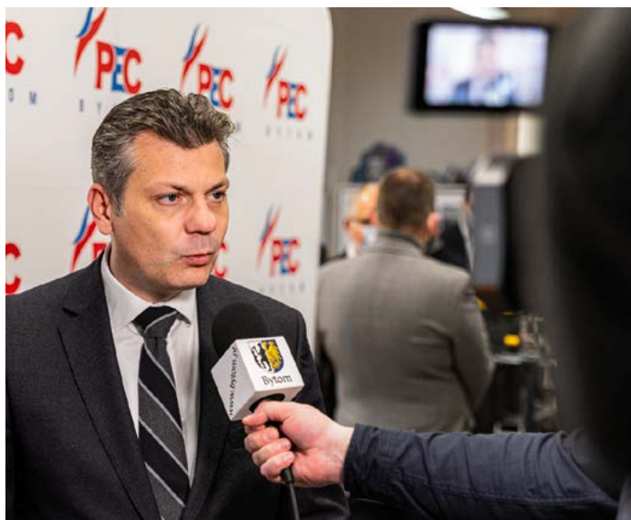
Mariusz Wołosz, prezydent Bytomia.

W 2022 r. planujemy kontynuację programu likwidacji kotłowni lokalnych oraz palenisk węglowych, poprzez podłączanie kolejnych budynków do miejskiego systemu ciepłowniczego. Zamierzamy również prowadzić dalszą modernizację istniejącej już infrastruktury ciepłowniczej.