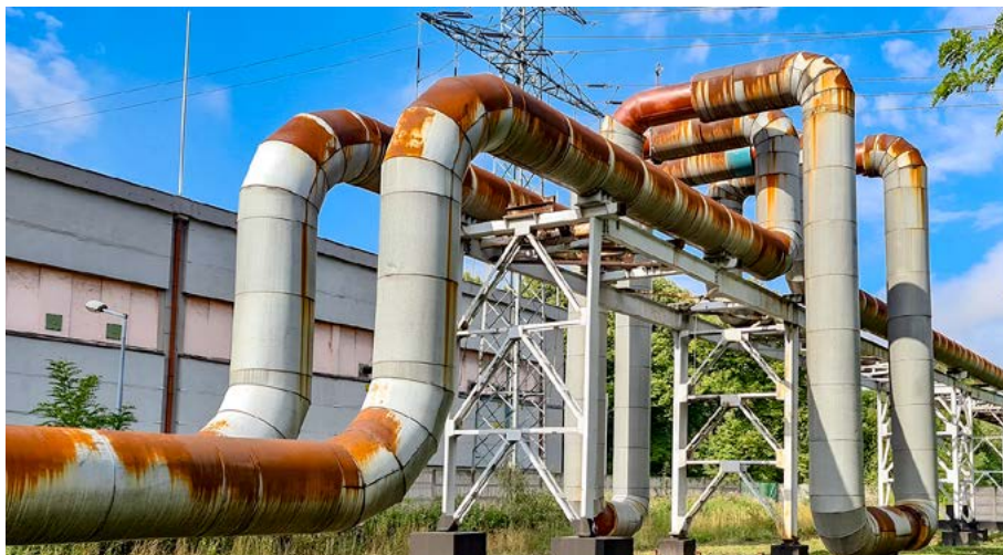
Sieć przed modernizacją (na terenie EC Szombierki).