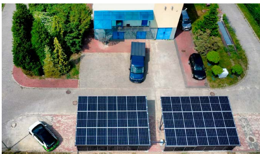
Instalacja OZE przy ul. Bławatkowej w Bytomiu.

W ramach zadań powstaną instalacje fotowoltaiczne, magazyny energii, stacje ładowania pojazdów elektrycznych oraz system