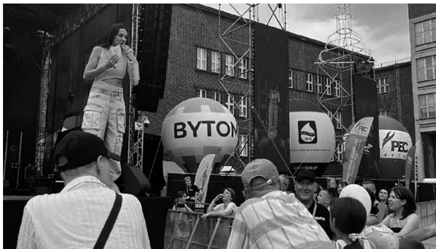
Bytomianie w tym roku bawili się na placu Sobieskiego.