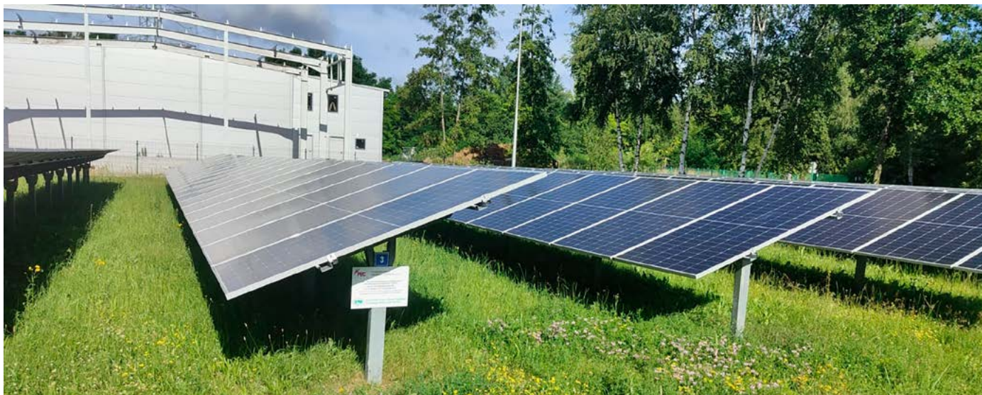
Panele fotowoltaiczne na terenie Ciepłowni Radzionków.