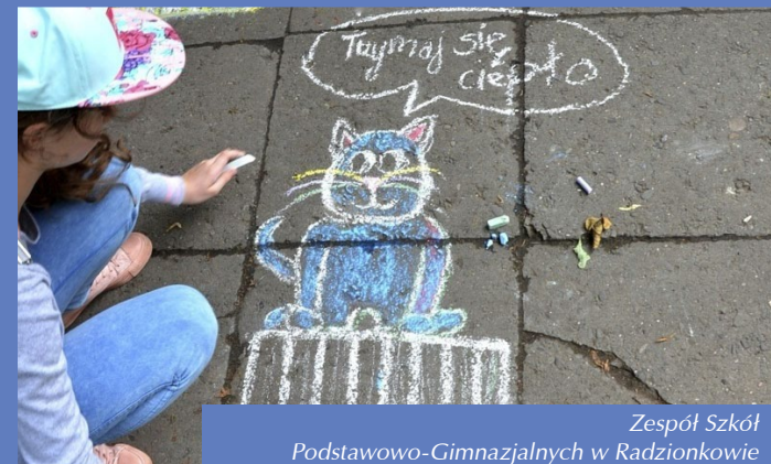
Zespół Szkół Podstawowo-Gimnazjalnych w Radzionkowie