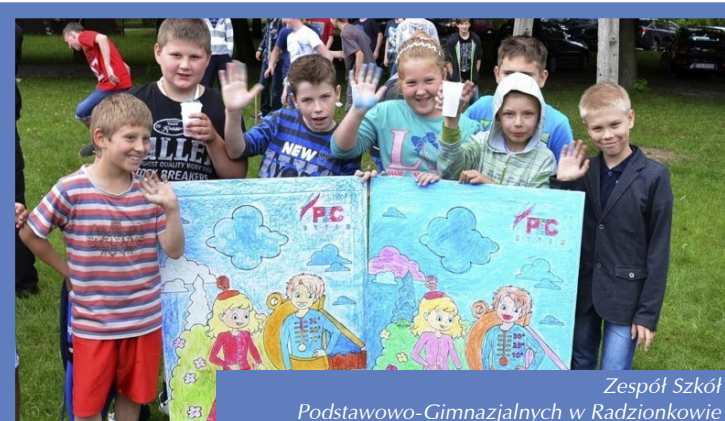
Zespół Szkół Podstawowo-Gimnazjalnych w Radzionkowie