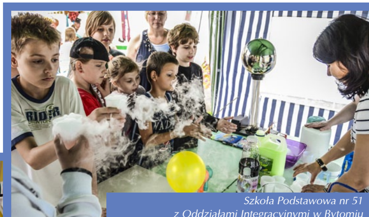
Szkoła Podstawowa nr 51 z Oddziałami Integracyjnymi w Bytomiu