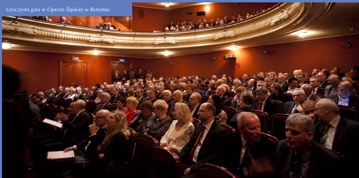
Uroczysta gala w Operze Śląskiej w Bytomiu

Informacje źródłowe na temat Programu Operacyjnego Infrastruktura i Środowisko na lata 2007-2013 znajdują się na stronie: www.pois.gov.pl