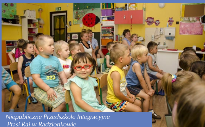
Niepubliczne Przedszkole Integracyjne Ptasi Raj w Radzionkowie

Przedszkole, szkoła, centrum handlowe, opera, prasa, internet – dla bytomskiego PEC-u każde miejsce jest dobre, aby prowadzić kampanię informacyjno-promocyjną realizowanego przez Spółkę projektu pn.: „Modernizacja gospodarki ciepłej dla gmin: Bytom i Radzionków” dofinansowanego z Unii Europejskiej ze środków Funduszu Spójności w kwocie 50 mln zł w ramach Działania 9.2 – Efektywna dystrybucja energii Programu Operacyjnego Infrastruktura i Środowisko 2007-2013.