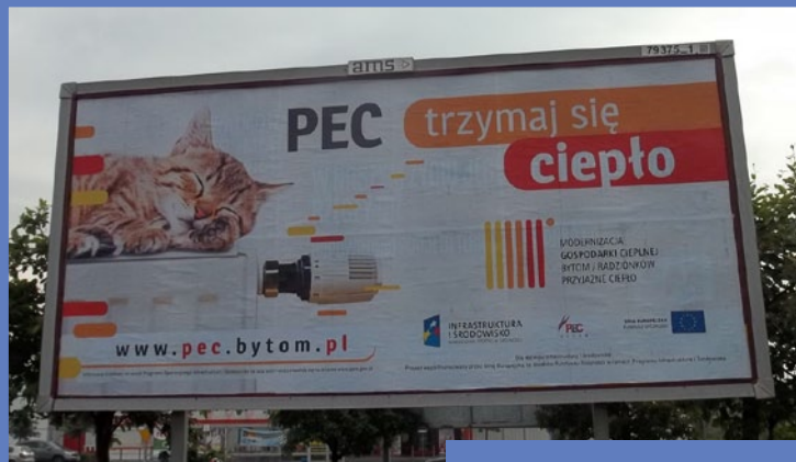
Billboard i tablica informacyjna