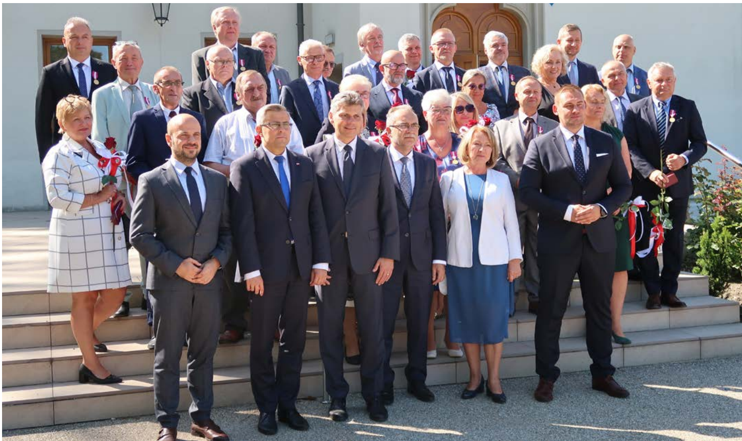
Odnaczeni pracownicy i zaproszeni goście.