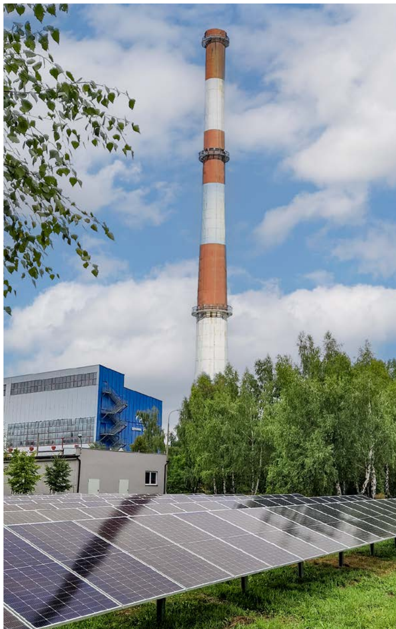
Instalacja PV na terenie Ciepłowni Radzionków.