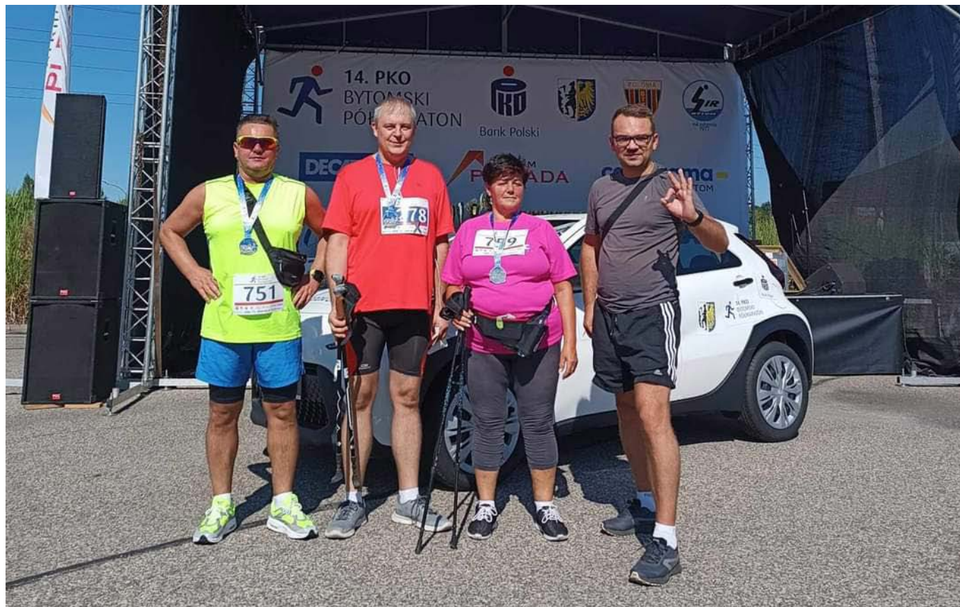
Reprezentanci naszego Przedsiębiorstwa.

Blisko 1400 zawodników i zawodniczek stawilo się na starcie 14. edycji PKO Bytomskiego Półmaratonu, który odbył się 16 września br. Tradycyjnie już start i meta znajdowały się na parkingu Centrum Handlowego Plejada. Bytomski bieg jest jednym z ważniejszych w regionie i cieszy się dużym zainteresowaniem miłośników biegania.