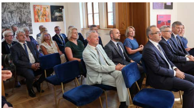
Uroczystość odbyła się w Pałacu w Miechowicach.